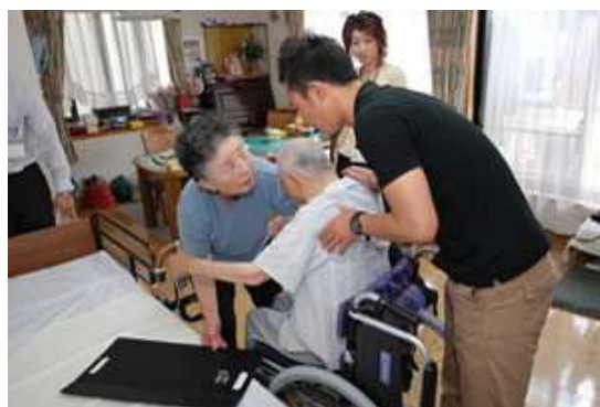
訪問相談：住宅改修、福祉用具など