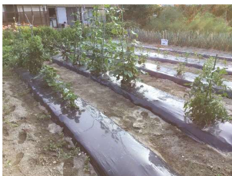
専用畑での園芸活動