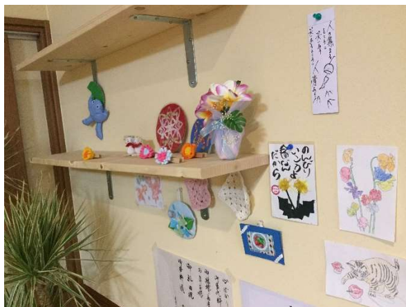
多彩な手工芸活動